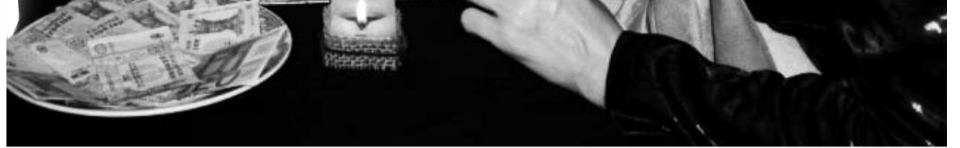
Persoanele care vin în casa decedatului ajută financiar rudele după posibilități

„Biserca ortodoxă a împrumutat mai multe practici de la diferite credințe, inclusiv și din păgînism, de exemplu, datul