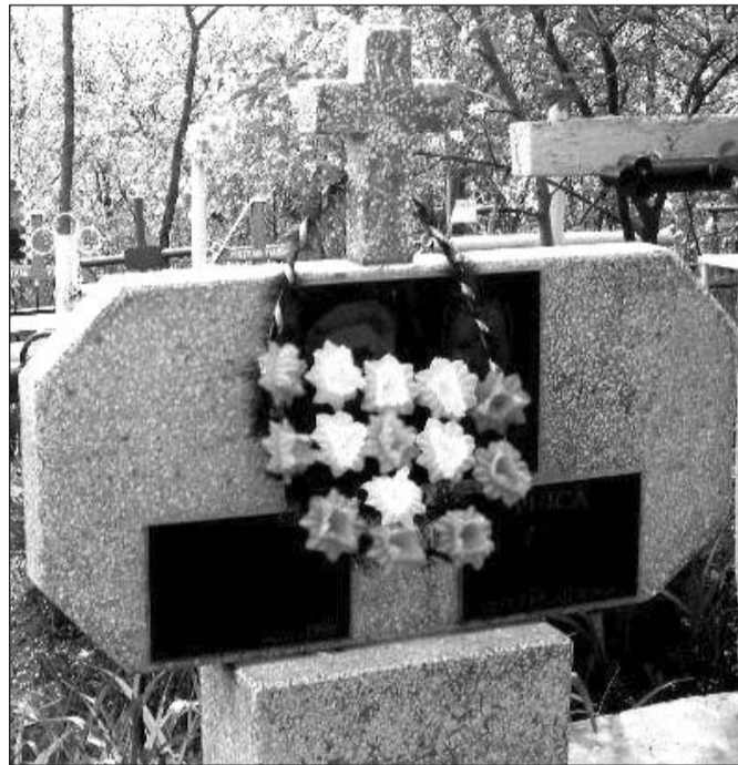
Acest monument din granit alb costă cca. 9900 de lei

Taxe există doar în Chișinău și variază în funcție de cimitir. De exemplu, în Cimitirul Sfîntul Lazăr , pentru înmormintări curen-