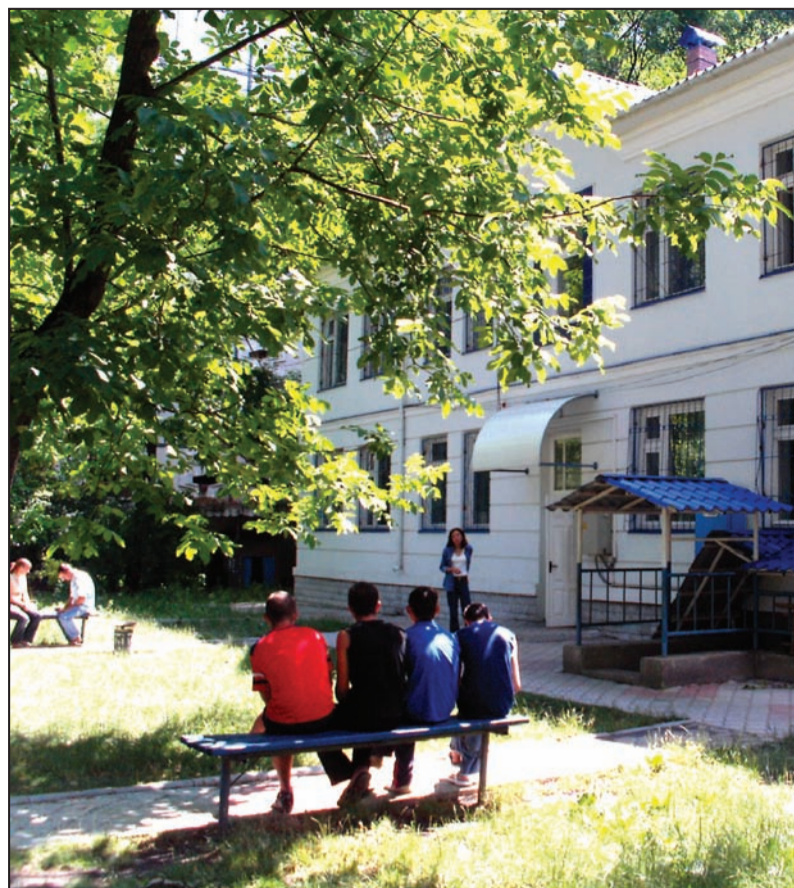
„Vatra” a devenit unica speranță a tinerilor fără de speranță