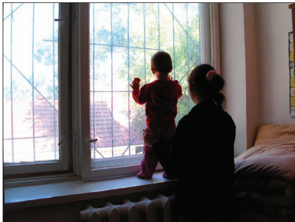
Mama și fiica sunt în așteptarea unor zile mai bune

Totuși, atunci când vorbesc de centru, tinerii zic că se simt bine. „Vatra” este casa noastră. Condițiile sunt bune. Ziua trece vesel pentru noi. Se mai întâmplă că ne mai certăm, dar cui nu i se întâmplă așa ceva?”, mă întreabă zâmbind Ștefan.