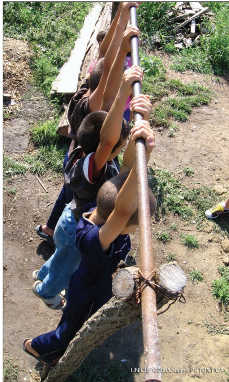
O problemă pentru cei de la agenție este de a găsi și a convinge angajatorii să accepte tinerii orfani