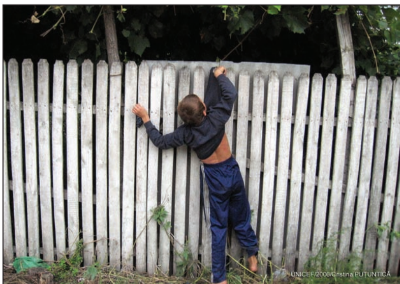
Toți copiii au drepturi egale la învățatură