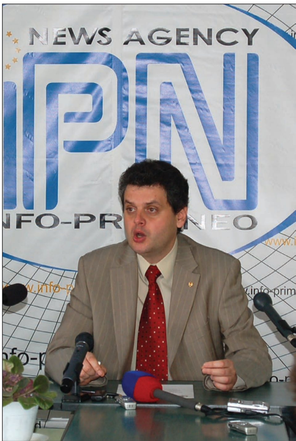
Oleg Serebrian crede că partidul de guvernământ stă la baza tuturor atacurilor în adresa opoziției

din partea autorităților, a sosit și rândul Partidului Social Liberal să își manifeste îngrijorarea față de modul în care se desfășoară campania pentru alegerile locale din 3 iunie.